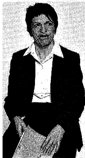
Ma il lavoro infermieristico è

La spinta vocazionale è prevalente, quasi il 60% ha scelto di fare l'infermiere perché «molto utile alla società» o perché «era la mia vocazione sin da piccolo».